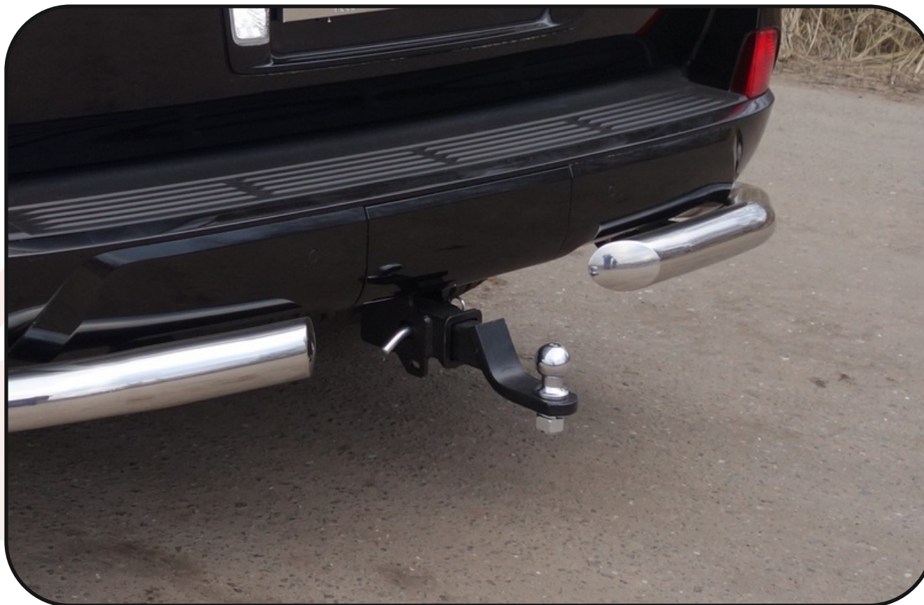
Фаркоп арт. LEXLX450d15-23F