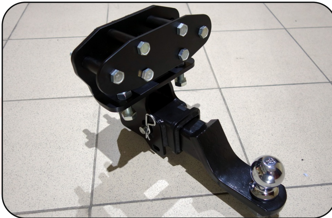
Фаркоп арт. TOYLC20015-27F