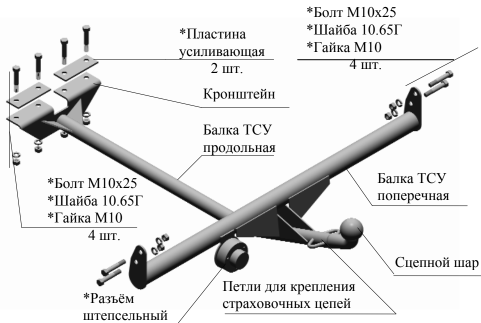
Рис.1 Тягово-сцепное устройство в сборе

Примечание: детали, помеченные * входят в пакет с комплектующими.